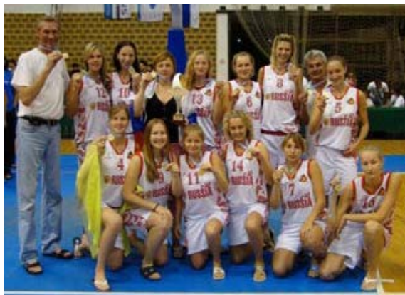
Сборная РГАУ-МСХА по баскетболу

57 студентов-спортсменов университета являются членами сборных команд Москвы и России.