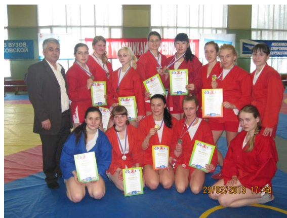
Сборная РГАУ-МСХА по самбо

Особой гордостью университета являются студенты – участники Олимпийских игр, победители и призеры чемпионатов мира, Всемирных Универсиад и сильнейшие спортсмены России.