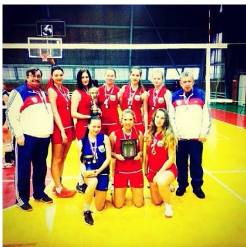
Сборная РГАУ-МСХА по волейболу