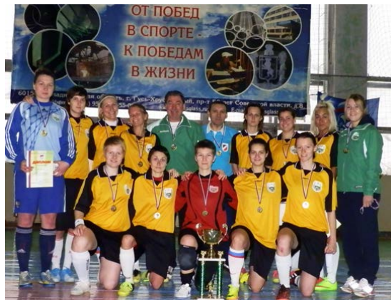
Сборная РГАУ-МСХА по мини-футболу