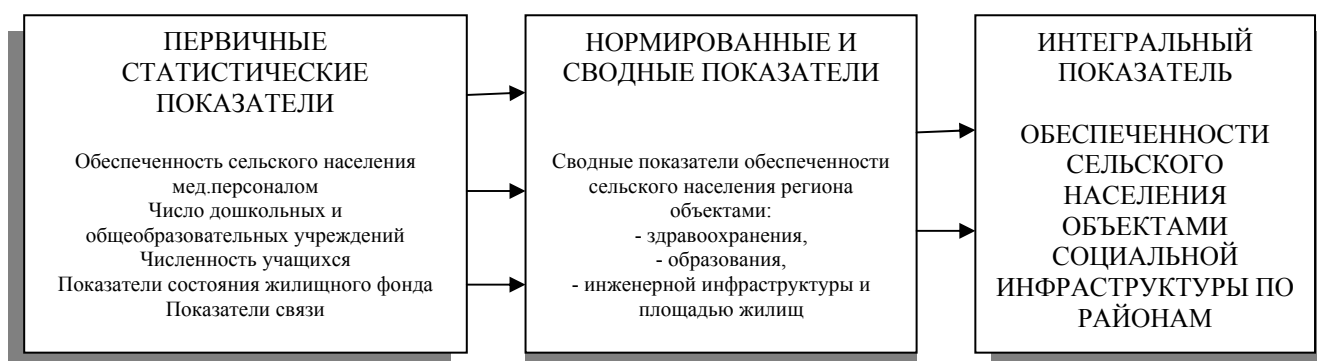
Рисунок 2 - Система показателей оценки обеспеченности территории объектами социальной инфраструктуры

Считаем, что в качестве методологической базы для анализа информации необходимо применять следующие параметры: общие статистические и расчетные статистические показатели (рис. 2).