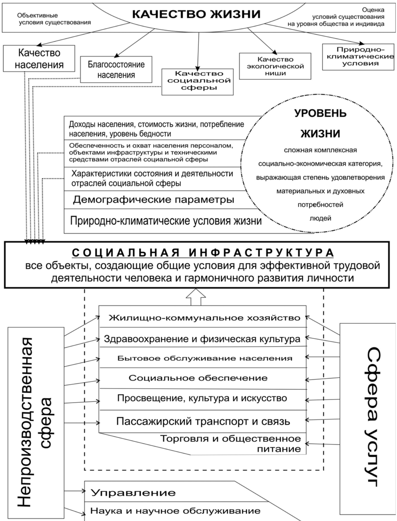
Рисунок 1 - Социальная инфраструктура в системе родственных категорий