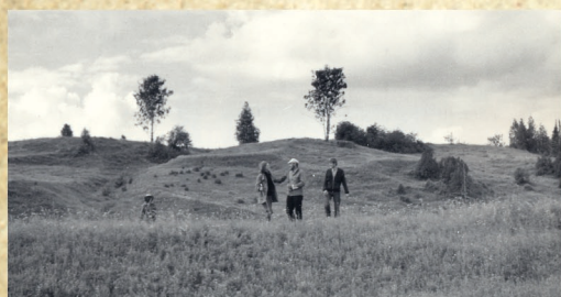
Участвовал и руководил разносторонними экспедиционными почвенно-мелиоративными исследованиями