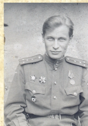
Гвардии капитан, начальник штаба инженерно-сапёрного батальона, Германия, апрель 1945