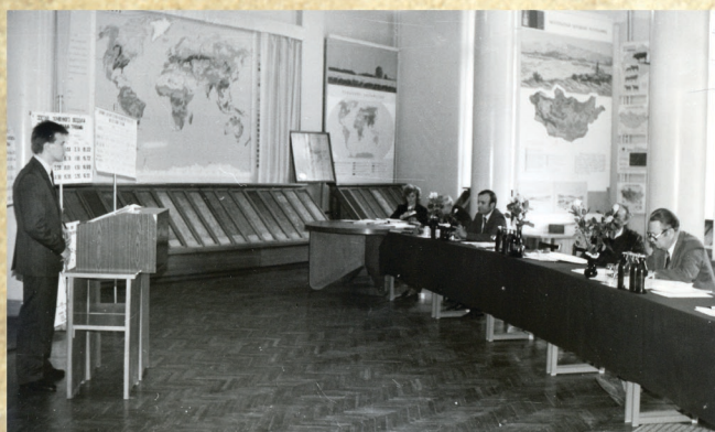
...член комиссии по защите дипломных работ в Музее почвоведения

1941-1946 гг. – воевал в составе: 7-го отдельного запасного инженерного полка под Житомиром; 19-го отдельного гвардейского батальона минёров на 3-м Украинском фронте; 64-й инженерной сапёрной бригады на 1-м Белорусском фронте. Участвовал в обороне городов: Киева, Харькова, Сталинграда; в боях по освобождению городов: Одессы, Варшавы, в штурме Берлина.