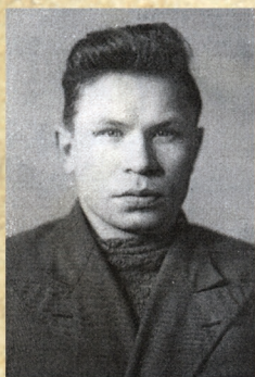
1959 г. – работал в составе экспедиции по освоению целинных земель в Монголии

Награждён орденами: Славы III степени, Отечественной войны I степени, Дружбы народов, «Знак Почёта» и 15 медалями СССР и РФ.