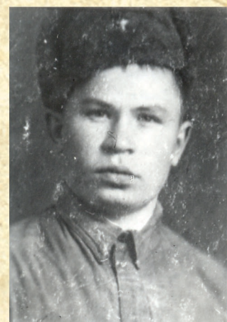
Курсант училища, 1942 г.

был оставлен в аспирантуре при кафедре экономики сельского хозяйства. В 1950 г. был переведён на работу в Минсельхоз СССР на должность помощника заместителя министра. В 1951 г. вернулся в академию, в 1953 г. защитил диссертацию и получил учёную степень кандидата экономических наук и был оставлен на кафедре в качестве ассистента. 1962-1971 гг. – доцент и профессор (в октябре 1969 г. защитил докторскую диссертацию). 1972-1979 гг. – заведующий кафедрой экономики сельского хозяйства. 1980-1986 гг. – декан экономического факультета ТСХА. 1986-1999 гг. – профессор кафедры